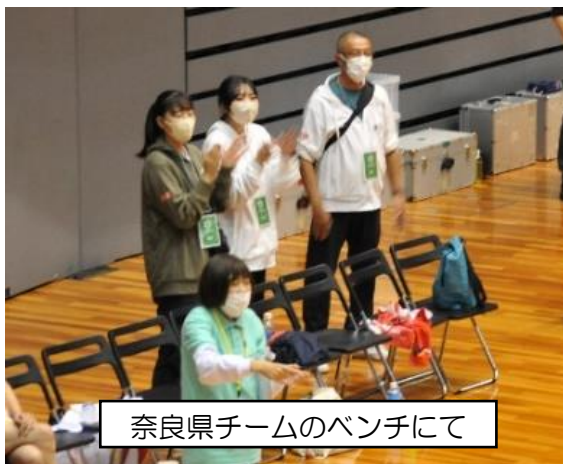
奈良県チームのベンチにて