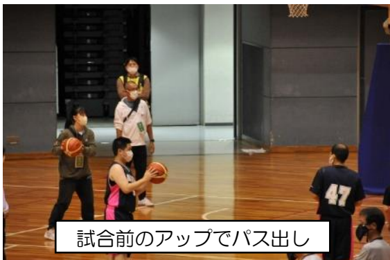
試合前のアップでパス出し