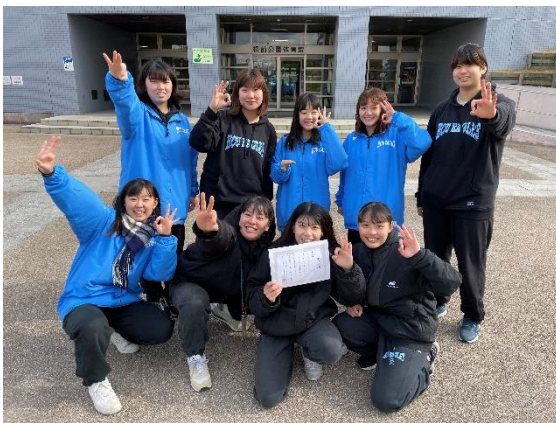
試合終了後賞状を手に松前体育館にて