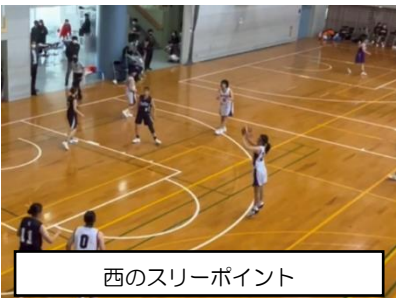
西のスリーポイント