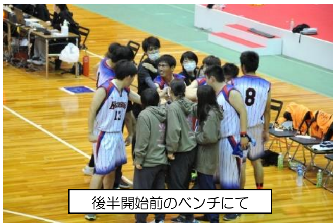
後半開始前のベンチにて