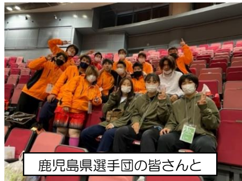
鹿児島県選手団の皆さんと

知的障害のある人たちが日本全国から集うスポーツの祭典が広島で開催された。バスケット部員も11月6日7日の2日間ボランティアとして参加した。バスケットボール競技が行われる広島グリーンアリーナと水泳競技が行われる呉市営プールに分かれての参加となった。アスリートに付き添い2日間を競技会場で共に過ごす「DAL」という役割であった。大会ボランティアの中でも最もアスリートの皆さんと近くで接する役割に、部員も最初は緊張している様子だったが、試合前のアップでボールをパスしたり、試合中にドリンクのお世話をしたり、応援したりするうちに、試合の合間に雑談をしたりする仲にまでなった者もいた。私自身も2日間観戦し、シュートを入れて喜ぶ選手やそれを応援する家族や関係者の人々の近くにいると、心が温くなる思いであった。