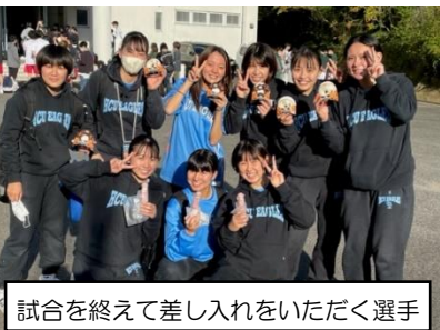
試合を終えて差し入れをいただく選手