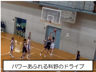
パワーあふれる科野のドライブ

入れ替え戦に回ることは本意ではあったが、気持ちを切り替えて、II部1位の広島文教大との試合に臨んだ。来年インカレに出場するためには、もちろん負けるわけにはいかない戦いである。振り返れば