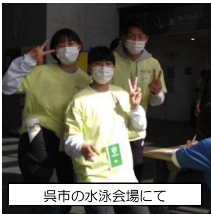
呉市の水泳会場にて

表彰式でも忘れられない場面に遭遇した。その直前に何があったのか分からないが、一人の選手が表彰台への登壇を拒んでいた。チームメイトはすでに表彰台に上がってメダルを受け取っていた。メダル授与者の有森裕子さんが、椅子に座ったままの選手の所まで行き、表彰台に上がろうと声をかけたのである。頑なに拒む選手と静まりかえった会場に時間だけが過ぎようとしたそのとき、有森さんは表彰台にすでに上がっている選手達を呼び、一緒に上がるように誘ってと声をかけたのである。2、3名の選手が表彰台から降り、彼の元へ近づき一緒に上がろうと誘った。それまで拒み続けていた彼は一変し、誘ってくれた仲間に抱きつき喜びを表現した。そのまま仲間に抱きかかえられて表彰台に登壇し、メダルを有森さんからかけてもらったのである。会場に盛大な拍手が湧き起こり、先ほどまで登壇を拒んでいた彼も嬉しくもあり、照れくさそうでもありといった表情で記念写真に収まっていた。表彰台でメダルを授与し讃えてあげたいという有森さんの思いと、彼を思いやる仲間の思いが会場全体を感動の渦に巻き込んだ場面であった。