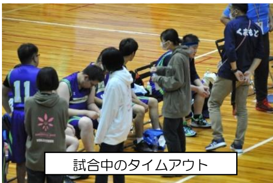
試合中のタイムアウト