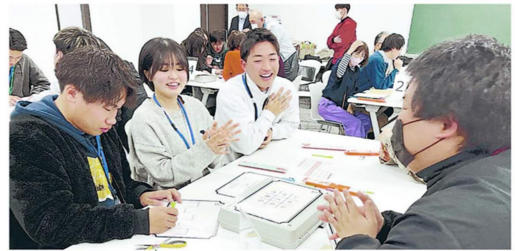
謎解きゲームで盛り上がる広島都市学園大の入学予定者たち (10日)