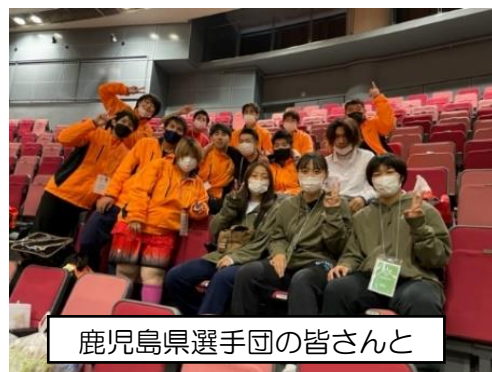
鹿児島県選手団の皆さんと

知的障害のある人たちが日本全国から集うスポーツの祭典が広島で開催された。バスケ部員も11月6日7日の2日間ボランティアとして参加した。バスケットボール競技が行われる広島グリーンアリーナと水泳競技が行われる呉市営プールに分かれての参加となった。アスリートに付き添い2日間を競技会場で共に過ごす「DAL」という役割であった。大会ボランティアの中でも最もアスリートの皆さんと近くで接する役割に、部員も最初は緊張している様子だったが、試合前のアップでボールをパスしたり、試合中にドリンクのお世話をしたり、応援したりするうちに、試合の合間に雑談をしたりする仲にまでなった者もいた。私自身も2日間観戦し、シュートを入れて喜ぶ選手やそれを応援する家族や関係者の人々の近くにいると、心が温くなる思いであった。